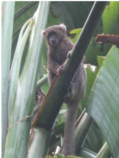
Fig. 3 (à gauche): Prolemur simus dans un arbre du voyageur Ravenala madagascariensis à Vohiposa.