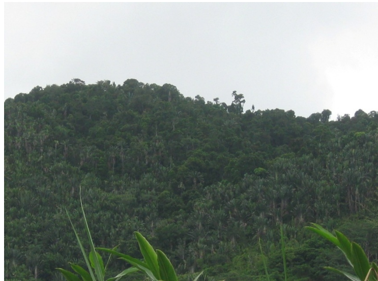
Fig. 4 (à droite): Site de Vohiposa, forêt de basse altitude sur les hauts versants et savoka à Ravenala madagascariensis en aval.