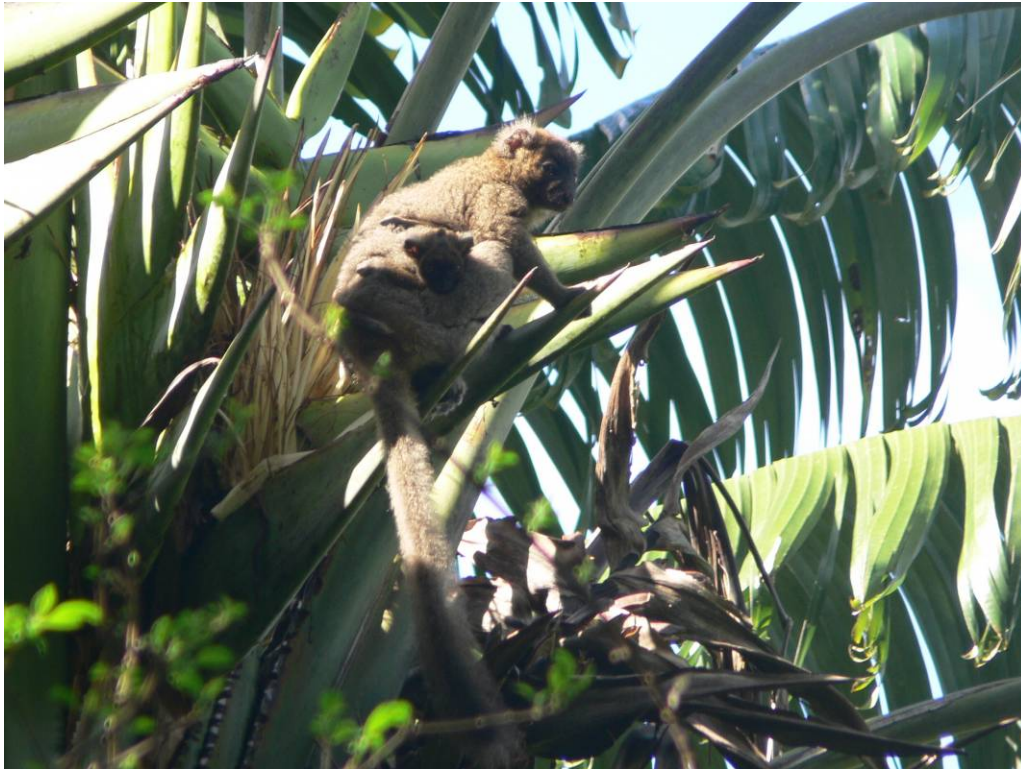
Fig. 7: Une femelle P. simus allaitante avec son petit né en novembre 2012, se nourrissant des fleurs de Ravenala madagascariensis , décembre 2012.