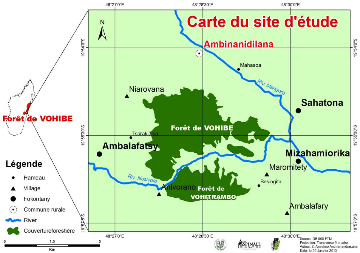
Fig. 1: Localisation du site d'étude.