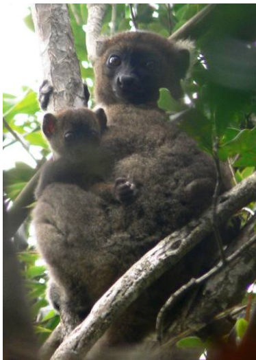
Fig. 4: Une femelle P. simus allaitante, avec son petit né en novembre 2011, et assise sur un Dracaena sp..