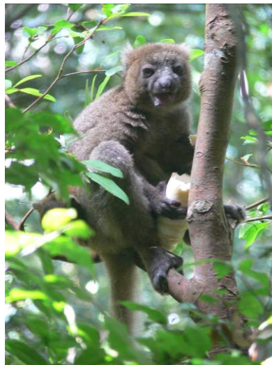
Fig. 5: Une femelle P. simus allaitante avec son petit né en novembre 2012 se nourrissant d'une partie molle des jeunes pousses de Catharystachys cf. capitata , décembre 2012.