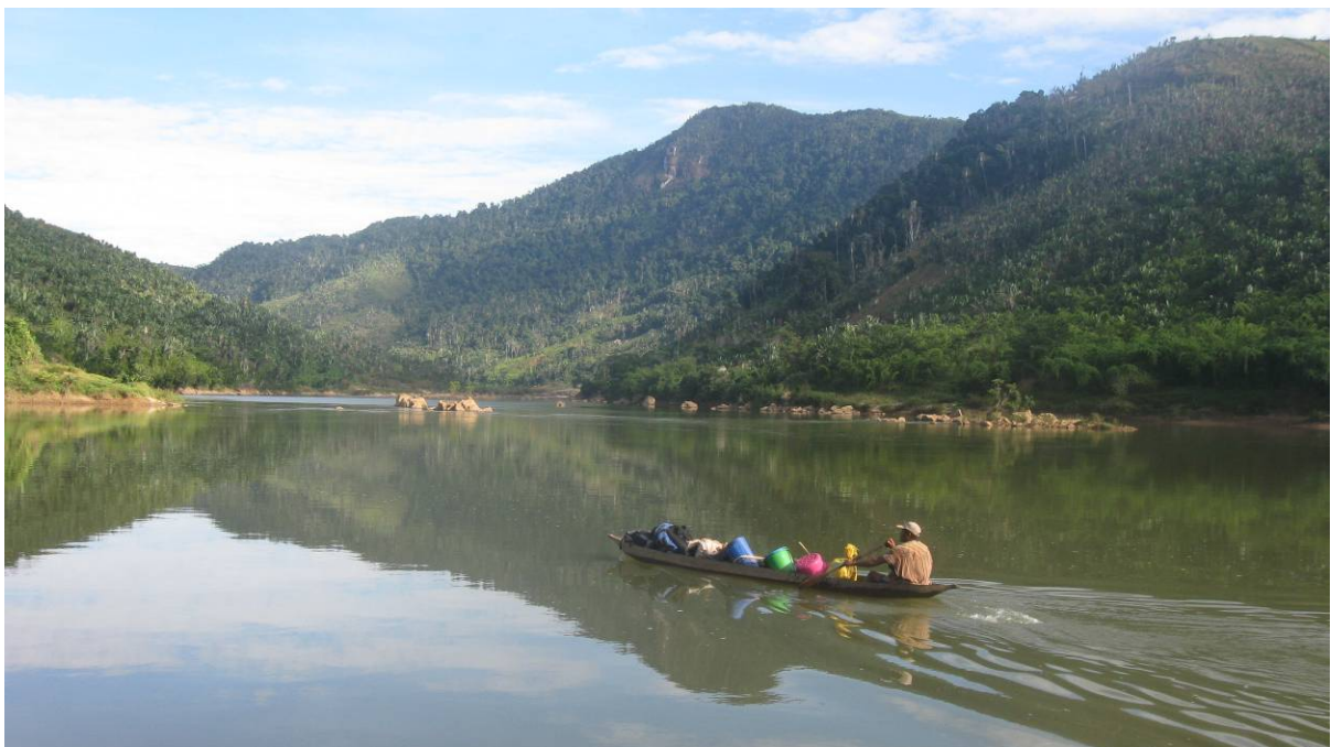
Fig. 2: La forêt de Vohibe sur la colline en arrière-plan de la rivière Nosivolo en juin 2011.