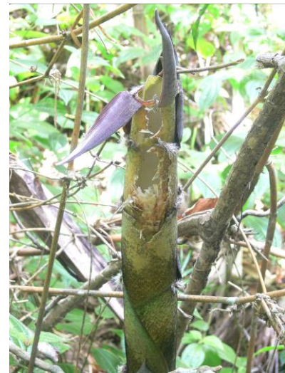
Fig. 6: Trace de nourrissage de P. simus sur Catharystachys cf. capitata dans la forêt de Vohibe, décembre 2012.